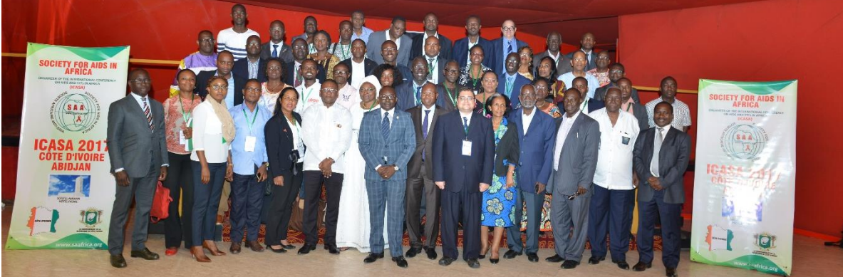
Photo de groupe de la première Réunion du CDI, Abidjan Côte d'Ivoire du 25-26 Novembre 2016